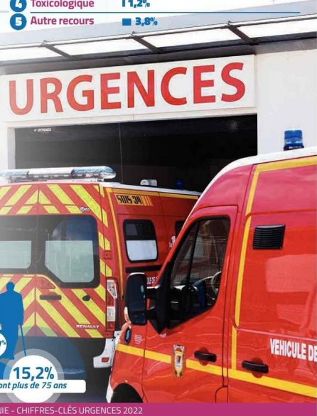
INFOGRAPHIE SOPHIE WAUQUIER / PHOTO : MIDI LIBRE JEAN-MICHEL MART / SOURCE : OBSERVATOIRE RÉGIONAL DES URGENCES OCCITANIE - CHIFFRES-CLÉS URGENCES 2022